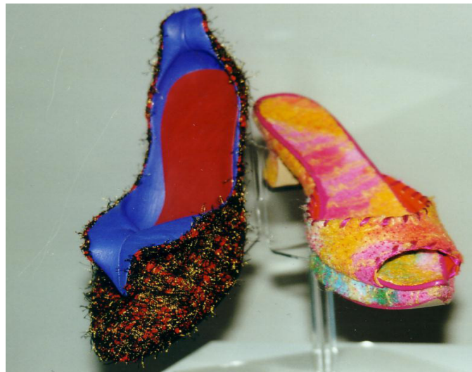
Abb. 1: Zwei Schuhe (aus: Ulich 1982, 13)